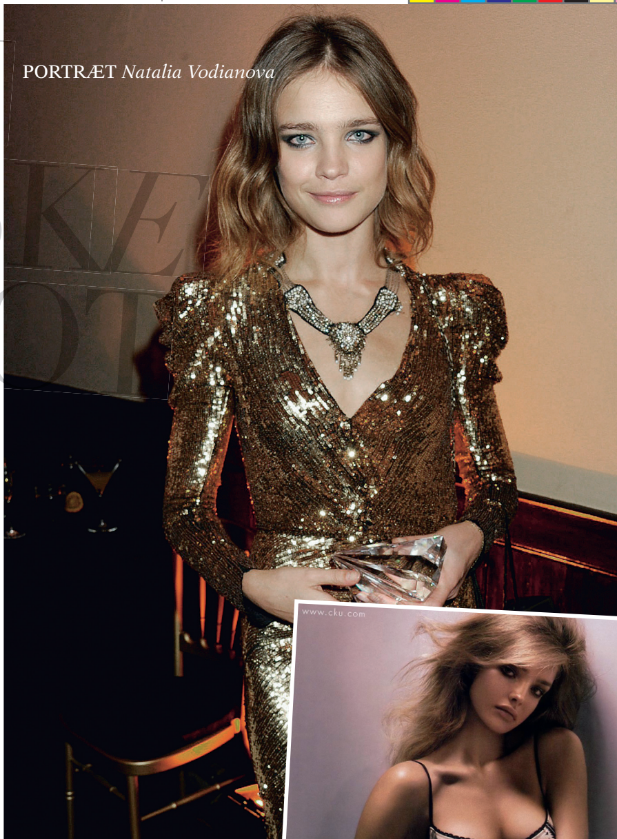
PORTRÆT Natalia Vodianova

“Hvorfor ikke bruge den styrke, jeg har med fra min barndom, til at udrette noget godt? Det her er ikke bare et velgørhedsprojekt. Det er blevet en del af mig, ligesom Rusland stadig er det.” ■